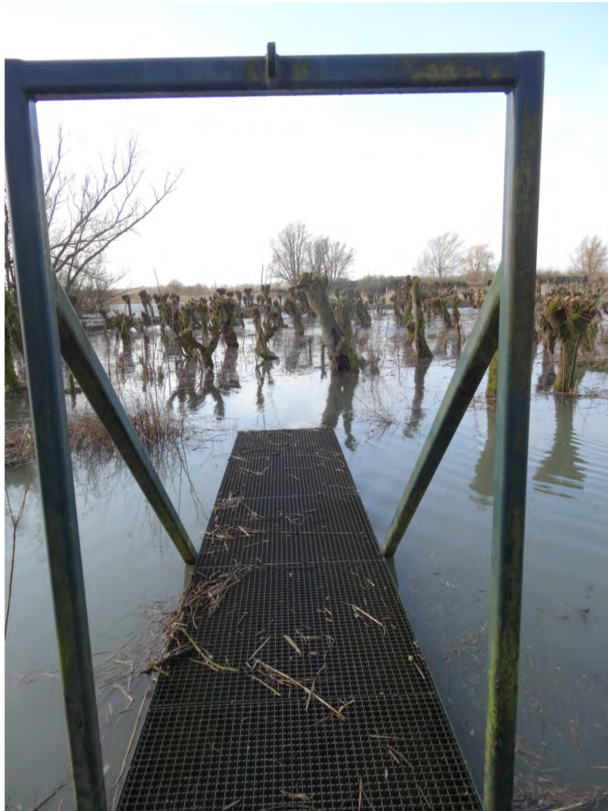
Buitemuseum de Pannekoek bij extreem hoog water in de Biesbosch