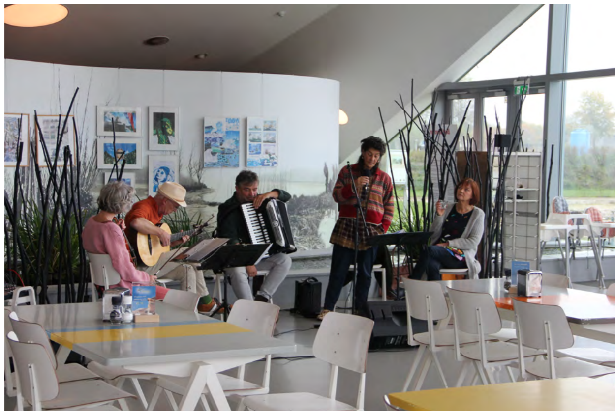
Het muzikensemble Zeevonk luspeelde bij de officiële opening van de expositie en ook tijdens het afsluitingsweekend

Belangstellenden kunnen zich via de link https://biesboschmuseumeiland.nl/steun-en-vrienden/ op onze website aanmelden bij de Vereniging.