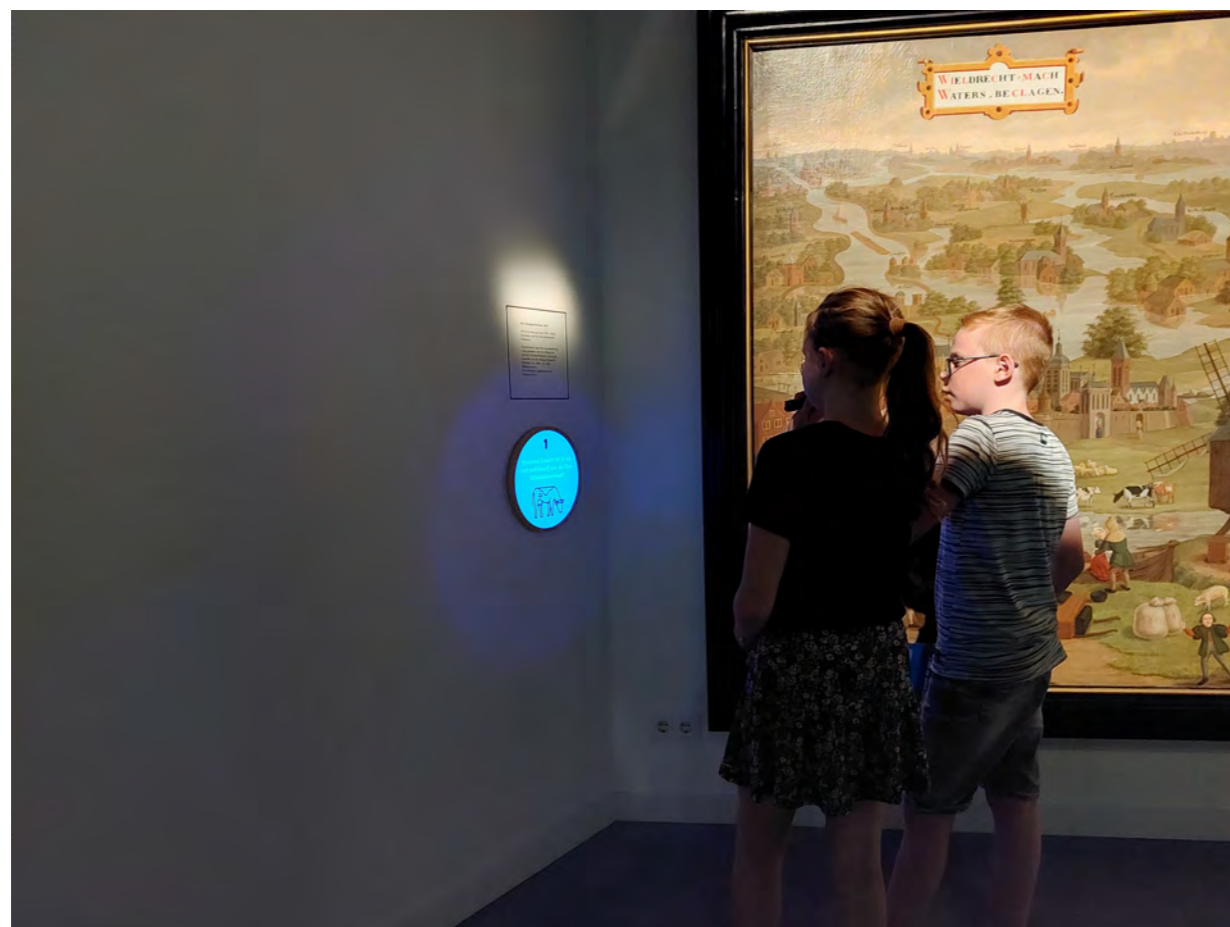
Studio Linksboven ontwikkelde een nieuwe speurtocht door het museum. waarbij opdrachten met behulp van een UV-lamp moeten worden opgespoord