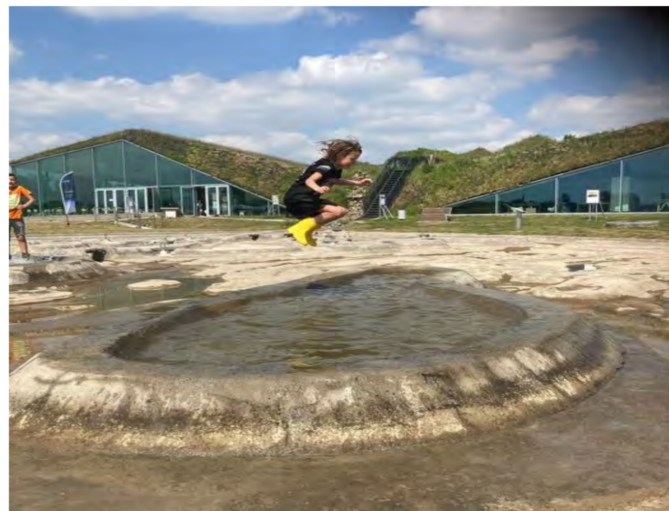
In de middag werden de deltakampioenschappen waterspatten in de Biesbosch Beleving op het Biesbosch MuseumEiland georganiseerd.