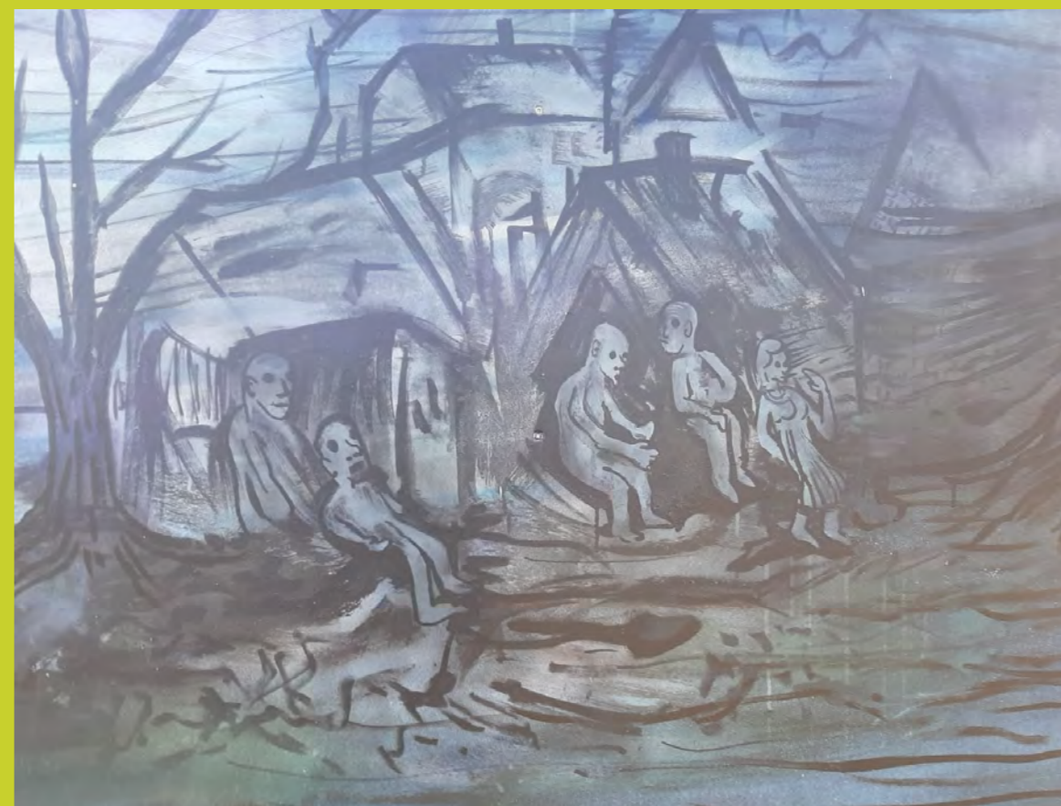
Fragment uit het drieluik van de Sint Elisabethsvloed van kunstenaar Florian Baltus.