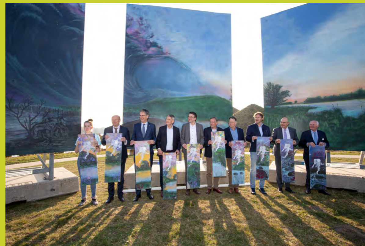
Openingshandeling bij het drieluik op het voorterrein van het museum.